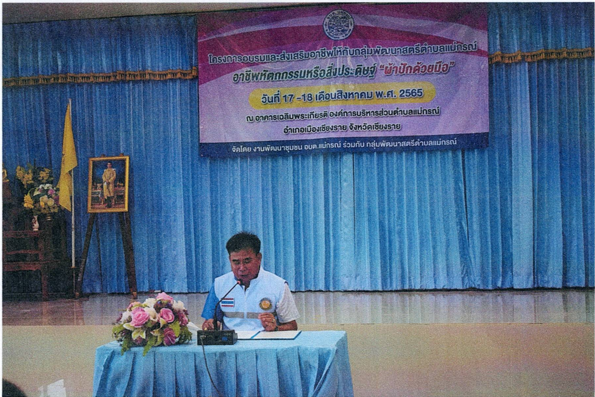
เว็บไซต์ : www.อบต.แม่กรณ์.เชียงราย.พ.ศ.2564